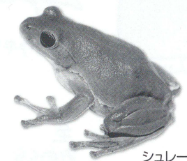
シュレーゲルアオガエル

長野県のほぼ中央、諏訪湖の北東に位置する霧ヶ峰高原の八島湿原にある町立のビジターセンターです。国の文化財である八島ヶ原湿原の生い立ちをわかりやすく説明した館内展示や四季折々の映像を通して八島湿原を中心とした地域の最新情報をお届けしています。